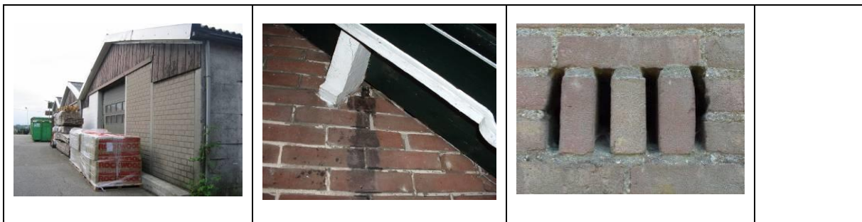
Figuur: voorbeelden van uitvliegopeningen van vleermuizen

De uitvliegende vleermuizen tel je gewoon één voor één, het liefst met behulp van een tikkenteller of een tally app (ios: advanced tally app, https://play.google.com/store/apps/details?id=com.yingwen.counter&hl=en . met instelling met 'record the timestamp for the +/- actions') omdat het soms erg snel kan gaan. Met een tikkenteller of tally app kun je naar de vleermuizen blijven kijken, terwijl een apparaat het aantal dieren bijhoudt. De tally app kan per uitvliegende vleermuis de tijd bijhouden, dat is leuk, omdat je dan later een grafiek van het uitvlieggedrag kan maken.